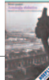
ANTOLOGIA DIABOLICA di Renzo Lavatori, Utet, pp. 678, € 25,00