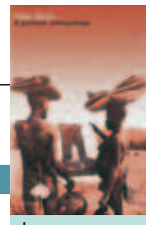
IL GIOVANE ANTROPOLOGO di Nigel Barley, Edizioni Socrates, pp. 224, € 12,50