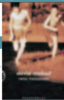
VERSO MEZZANOTTE di David Malouf, Frassinelli, pp. 270, € 18,00